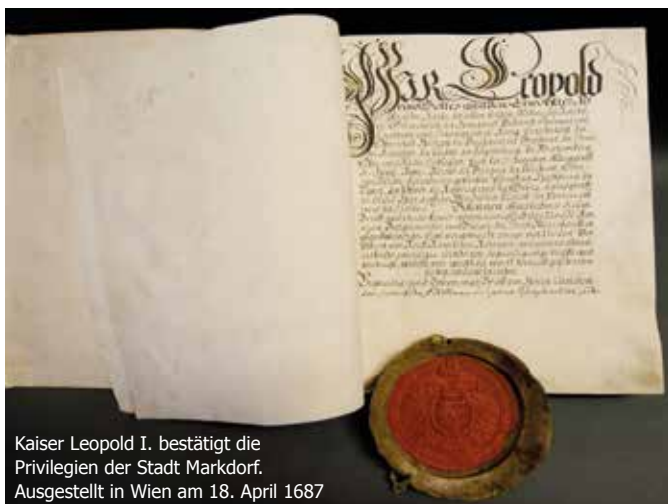
Kaiser Leopold I. bestätigt die Privilegien der Stadt Markdorf. Ausgestellt in Wien am 18. April 1687

Markdorf liegt in der uralten Kulturlandschaft des Bodensees, die schon vor 5.000 J. besiedelt war. Die ersten Siedlungsspuren der Kelten stammen aus dem 2. Jh. v. Chr. und werden mit den Funden bei der Viereckschanze Markdorf-Riedwiesen eindeutig belegt. Im Mittelalter lag Markdorf an der Handelsstraße zwischen Zürich und Ravensburg und am Oberschwäbischen Jakobsweg von Ulm bis Konstanz, der von dort weiter nach Santiago de Compostela verläuft.