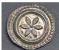
Der Mark- dorfer Brakteat

Schulhaus, Kornhaus, Obertorturm und Helltorturm wurden Opfer der Flammen. Aus den Erfahrungen des Brandes wurde ein großer freier Marktplatz geschaffen. Die historische Altstadt hat sich seit jener Zeit städtebaulich kaum verändert und erfreut heute die Besucher mit ihrem ganz besonderen Charme.