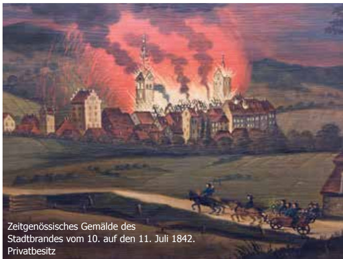
Zeitgenössisches Gemälde des Stadtbrandes vom 10. auf den 11. Juli 1842. Privatbesitz