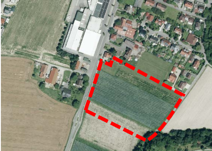
Lage des Änderungsbereichs Wohnbaufläche Oberteuringen West / Östlich Raiffeisenstraße (rot dargestellt)

Der Vorentwurf der 7. Änderung des Flächennutzungsplans wird mit Begründung und dem Vorentwurf des Umweltberichts vom