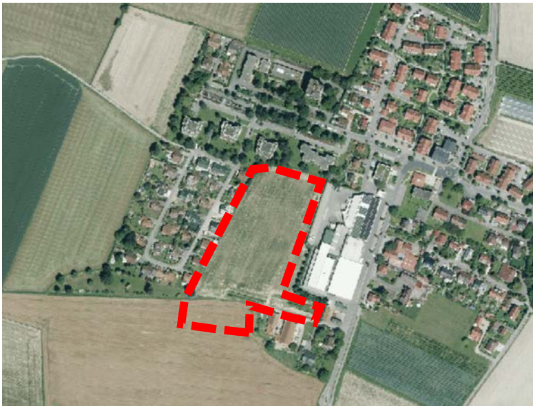
Lage des Änderungsbereichs Wohnbaufläche Oberteuringen West / Brahmweg (rot dargestellt)

Der Änderungsbereich befindet sich im zentral-westlichen Bereich der Gemeinde. Im Westen und Norden ist dieser von Wohnbebauung umgeben. Im Osten grenzen gewerblich genutzte Flächen an, auf denen sich ein Supermarkt sowie ein Raiffeisenmarkt befinden. Der Änderungsbereich umfasst die Flurstücke Nrn. 2521, 2521/2, 2517/1 und einen Teilbereich des Wegeflurstücks Nr. 2519/1. Die Fläche hat eine Größe von ca. 2,6 ha.