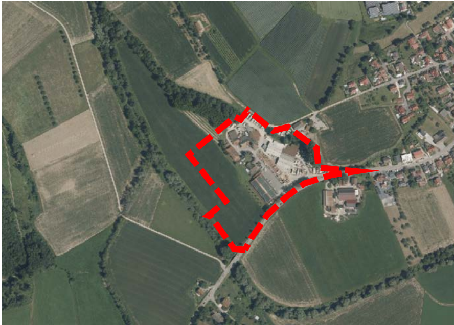
Lage des Änderungsbereichs Untere Mühle (rot dargestellt)

Die Fläche umfasst die Flurstücke Nrn. 264/3, 265, 266, 275/1, 275/2, einen Teilbereich des Flurstücks des Mühlkanals und eine Teilfläche des Flurstücks Nr. 264. Der Änderungsbereich betrifft eine Fläche von ca. 4,6 ha. (Ein Teilbereich von ca. 0,8 ha, wird lediglich aus plangrafischen Gründen mit in den Änderungsbereich aufgenommen, die Art der baulichen Nutzung ändert sich für diesen Teilbereich jedoch nicht (gemischte Baufläche)).