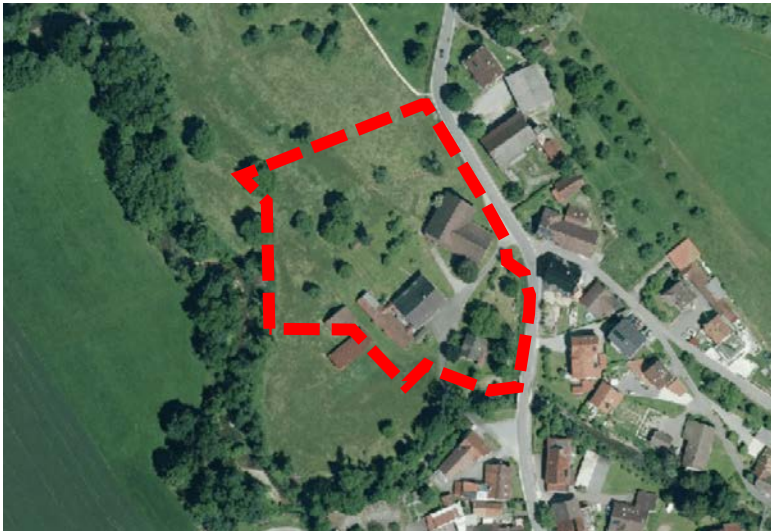
Lage des Änderungsbereichs Alte Mühle Urnau (rot dargestellt) (Quelle Luftbild: Geoportal BW 2023)

Der Änderungsbereich „Alte Mühle Urnau“ befindet sich im Norden des Ortsteils Urnau der Gemeinde Deggenhausertal. Östlich verläuft die Rotachstraße. Westen der Fläche verläuft die Rotach. Der Änderungsbereich umfasst Teilbereiche der Flurstücke Nrn. 106 und 7 und einen Teilbereich des Wegeflurstücks Nr. 8/1. Die Fläche umfasst ca. 1,1 ha.