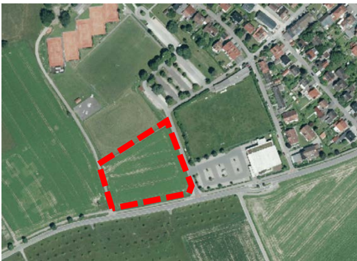
Lage des Änderungsbereichs Gemeinbedarfsfläche Feuerwehr (rot dargestellt)

Der Änderungsbereich befindet sich am westlichen Ortsrand Bermatingens, westlich des Nah+Gut nördlich der Meersburger Straße. Östlich und westlich verläuft die Straße In der Breite. Nördlich des Änderungsbereichs befindet sich eine Sportanlage. Der Änderungsbereich umfasst das Flurstück Nr. 716/71. Die Flächengröße beträgt ca. 0,8 ha.