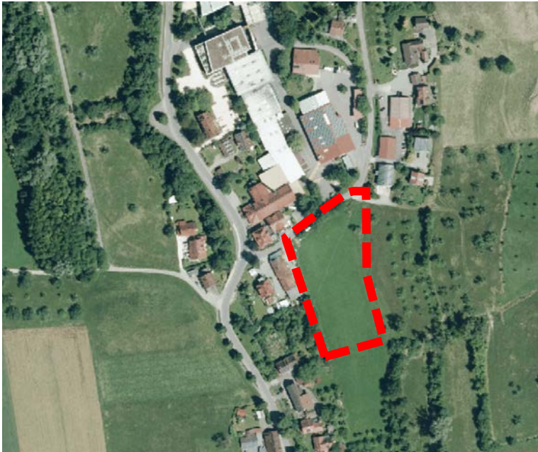
Lage des Änderungsbereichs Gewerbeerweiterung Firma Sonett (rot dargestellt)

gegenüberliegenden Seite des Ziegeleiwegs befindet sich die Firma Sonett, welche erweitert werden soll. Die Fläche umfasst einen Teilbereich des Flurstücks Nr. 55 und beläuft sich auf ca. 1,1 ha.