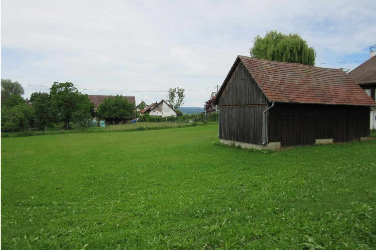
Abbildung 5: Schuppen und Grünland