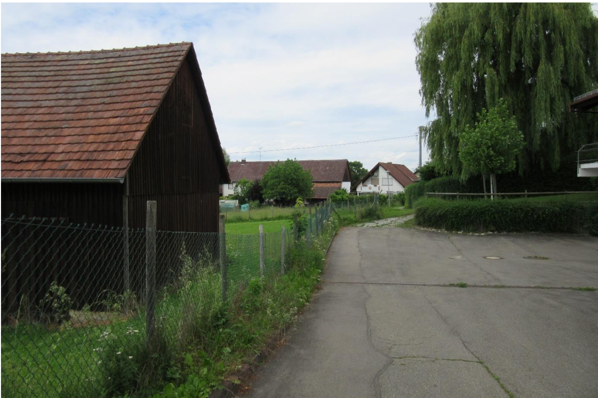
Abbildung 6: Schuppen und angrenzende Zufahrt Feuerwehrhaus