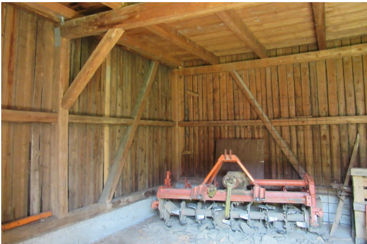
Abbildung 8: Innenansicht Schuppen