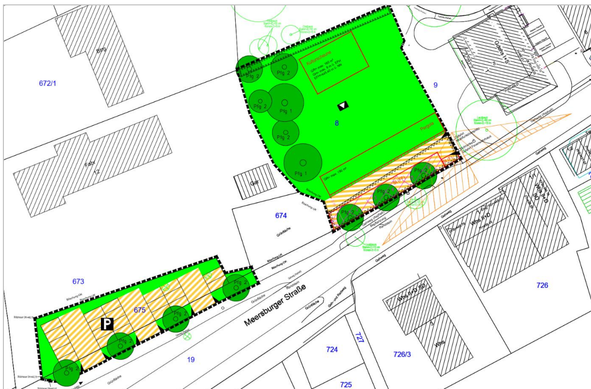
Abbildung 1: Bebauungsplan „Azenberg, 2. Änderung“ (Dorfplatz)

Der Ittendorfer Dorfplatz ist bereits im aktuell gültigen Bebauungsplan „Azenberg“ von 1993 als Grünfläche mit der Zweckbestimmung „Geplanter Dorfplatz“ dargestellt. Seit 2020 befindet sich das Grundstück mit der Flurstücknummer 8 in kommunaler Hand. Im Jahr 2022 wurde der Dorfplatz im Rahmen eines Gemeindeentwicklungskonzeptes konkretisiert. Der Entwurf sieht eine Verlegung der bestehenden Scheune vor. Die Verlegung und Umgestaltung der Scheune dient vorrangig dem Zweck, im hinteren Bereich des Dorfplatzes eine „Kulturscheune“ mit Bühne zu realisieren und den zentralen Bereich des Platzes für vielfältige Nutzungen frei von Bebauung zu halten. Die kulturelle Nutzung des Dorfplatzes und der Kulturscheune soll im Wechselspiel mit dem angrenzenden Feuerwehrhaus/ Bürgerhaus (Flurstück 9) bespielt werden. Die (Lärm-) Emissionen, die von der angrenzenden Bundesstraße ausgehen, werden in der Gestaltung des Platzes berücksichtigt und sollen u.a. mittels einer gestalteten Lärmschutzwand Nutzer des Platzes schützen und gleichzeitig die Belange der angrenzenden Feuerwehr berücksichtigen. Gleichwohl wird in der Gestaltung beachtet, wie Anwohner vor (Lärm-) Emissionen geschützt werden können. Um die Voraussetzung für die Realisierung des Dorfplatzes mit Anlage einer Lärmschutzwand und der Verlegung der Scheune zu schaffen, soll der Bebauungsplan „Azenberg“ in diesem Teilbereich geändert werden. Zudem sollen Parkplätze auf Flst. 675 festgesetzt werden.