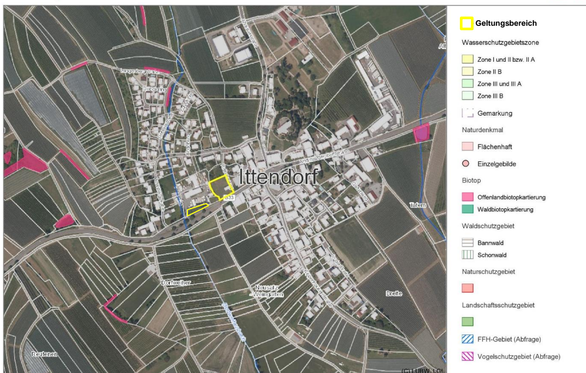
Abbildung 2: Übersichtskarte mit Lage des Geltungsbereichs (gelb), o.M.