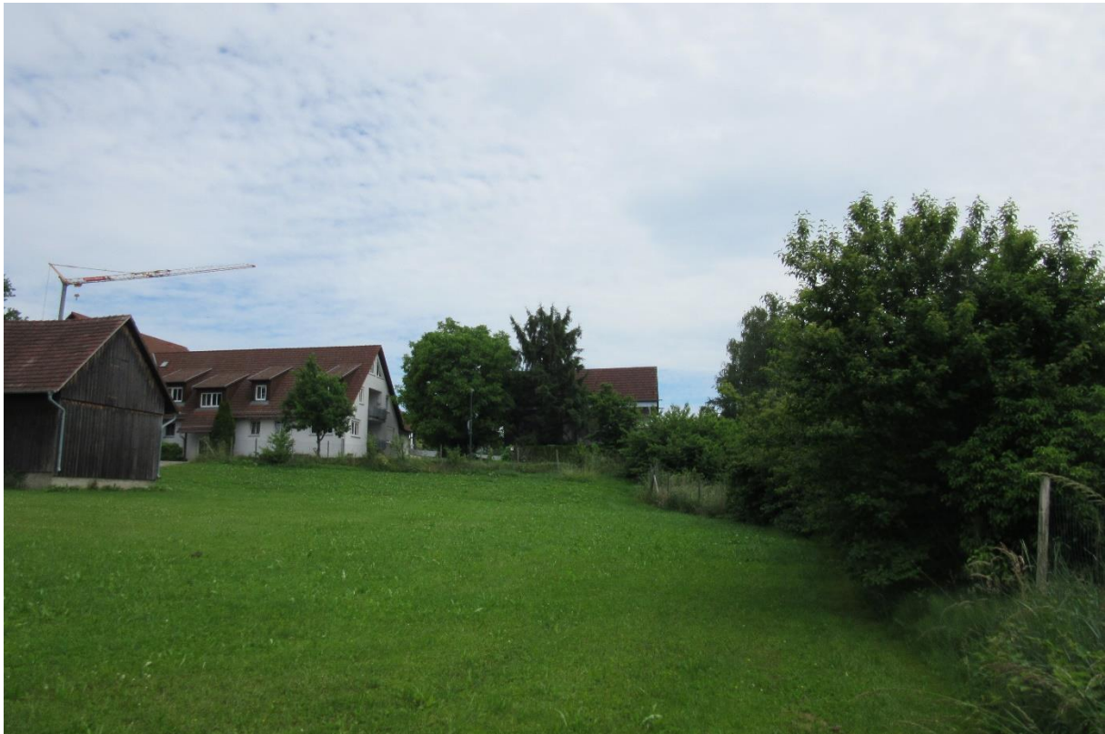
Abbildung 7: Grünland und angrenzende Hecke