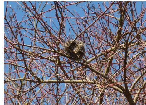
Abb. 11: Altnest eines kleinen Gehölzfreibrüters am Rand des Geltungsbereiches.

Grundsätzlich ist im Gebiet nicht mit dem Vorkommen seltener, störungsempfindlicher Arten zu rechnen, da eine rege Nutzung des Geländes durch Spaziergänger, Fahrradfahrer, Schul- und Kindergartenkinder sowie Tennisspieler stattfindet. Eine Brut ist nur für ubiquitäre, kulturfolgende Arten zu erwarten.