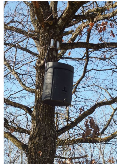
Abb. 10: Fledermaus-Großraumhöhle in der Umgebung des Geltungsbereiches

An einer Eiche entlang des Rotach-Ufers, unweit des Eingriffsbereiches wurde eine Fledermaus-Großraumhöhle aufgehängt. Auf einen Besatz wurde diese während der Begehung zwar nicht überprüft, jedoch wurde auf Anfrage von der Gemeinde mitgeteilt, dass bei einer jüngst stattgefundenen Kontrolle des Kastens durch Mitarbeiter des Bauhofes keine Nutzung durch Fledermäuse nachgewiesen werden konnte. Es wurde dabei jedoch eine Meise innerhalb der Höhle angetroffen.