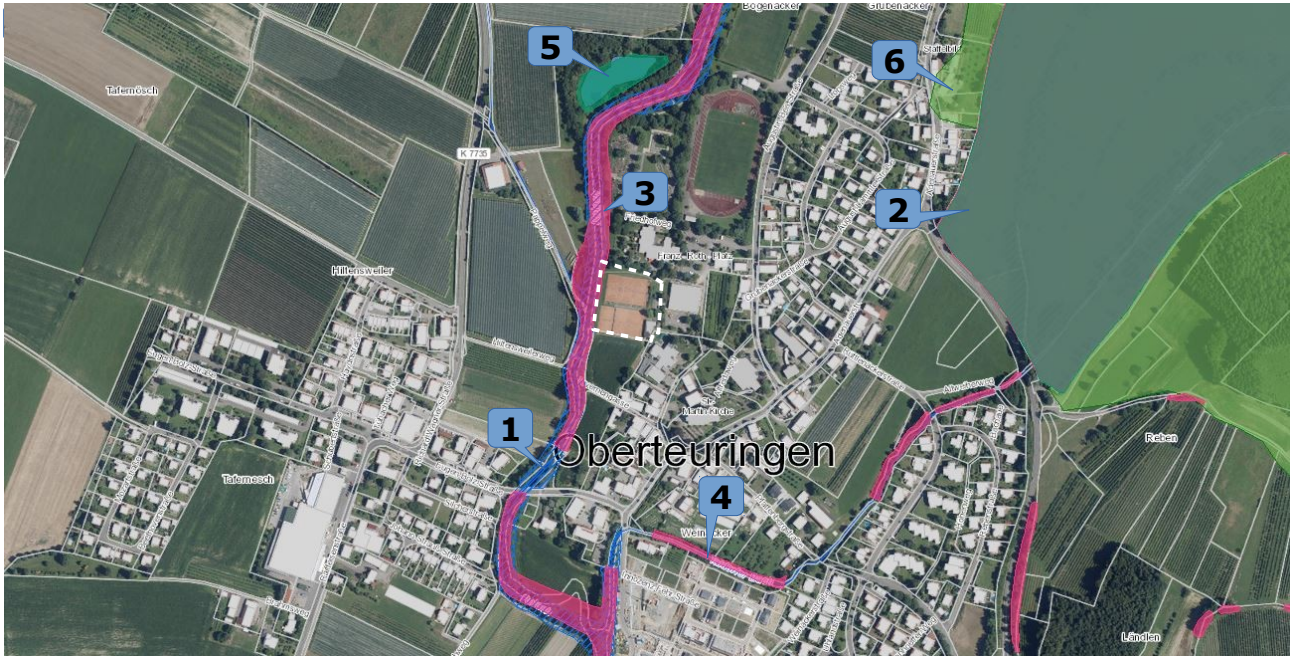
Abb. 7: Orthofoto des Planungsraumes mit Eintragung der Schutzgebiete in der Umgebung.