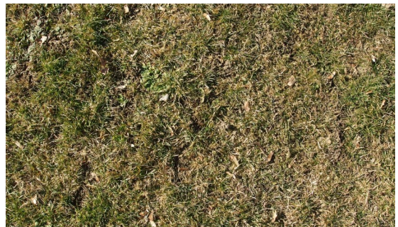
Abb. 6: Ausschnitt aus dem nördlich gelegenen Grünlandbestand.

Bei den Wiesen handelt es sich um häufig gemähtes und artenarm ausgeprägtes Intensivgrünland. Die grasdominierten Bestände werden von Wiesen-Rispengras ( Poa pratensis ), Kriechendem Günsel ( Ajuga reptans ), Gundelrebe ( Glechoma hederacea ), Gänseblümchen ( Bellis perennis ), Kriechendem Fingerkraut ( Potentilla reptans ) und Gemeiner Schafgarbe ( Achillea millefolium ) geprägt.