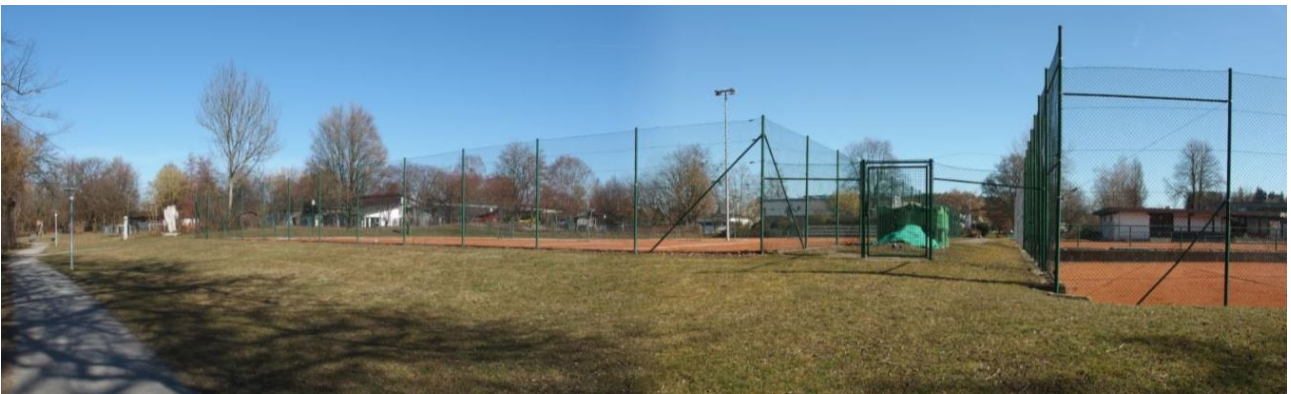
Abb. 5: Überblick über den Geltungsbereich aus süd-westlicher Richtung. Umzäunte Spielfelder des Tennisplatzes mit umgebenden Grünlandflächen und das Vereinsgebäude rechts im Hintergrund.

Bei den Wiesen handelt es sich um häufig gemähtes und artenarm ausgeprägtes Intensivgrünland. Die grasdominierten Bestände werden von Wiesen-Rispengras ( Poa pratensis ), Kriechendem Günsel ( Ajuga reptans ), Gundelrebe ( Glechoma hederacea ), Gänseblümchen ( Bellis perennis ), Kriechendem Fingerkraut ( Potentilla reptans ) und Gemeiner Schafgarbe ( Achillea millefolium ) geprägt.