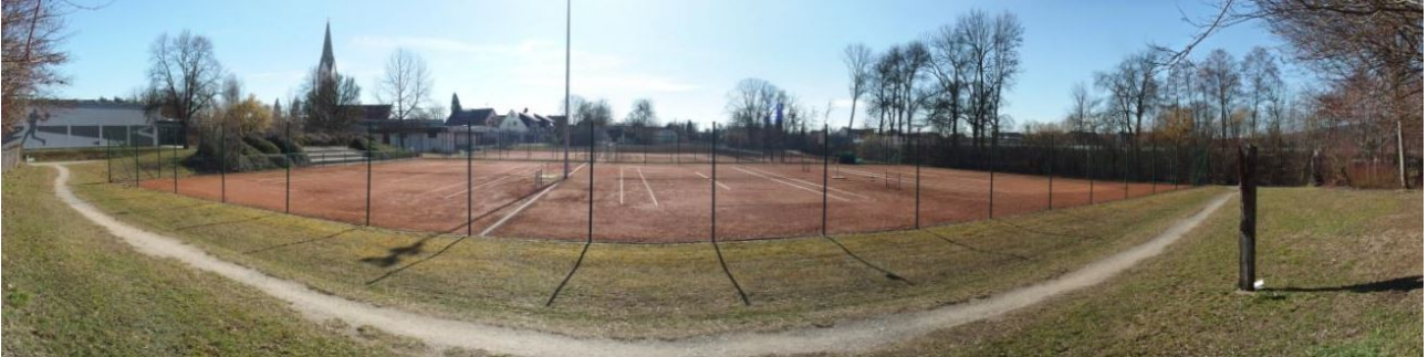
Abb. 4: Überblick über den Geltungsbereich aus nördlicher Richtung. Trampelpfad innerhalb des Intensivgrüns. Umzäunte Tennisfelder mit kleiner Zuschauertribüne (links). Verlauf der Rotach mit uferbegleitenden Gehölzen (rechts).

Die überplante Fläche wird überwiegend von einem Tennisplatz mit sechs Spielfeldern und dem südöstlich gelegenen Vereinsgebäude eingenommen. Randlich und in der Mitte zwischen den nördlich und südlich gelegenen Feldern befinden sich Grünlandflächen und kleinere Gehölzbestände.