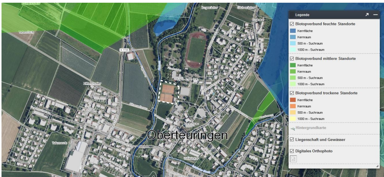
Abb. 8: Biotopverbund (farbige Flächen) in der Umgebung des Geltungsbereiches (weiß gestrichelte Linie)

Der Fachplan „Landesweiter Biotopverbund“ stellt im Offenland drei Anspruchstypen dar – Offenland trockener, mittlerer und feuchter Standorte. Innerhalb dieser wird wiederum zwischen Kernräumen, Kernflächen und Suchräumen unterschieden. Kernbereiche werden als Flächen definiert, die aufgrund ihrer Biotopausstattung und Eigenschaften eine dauerhafte Sicherung standorttypischer Arten, Lebensräume und Lebensgemeinschaften ermöglichen können. Die Suchräume werden als Verbindungselemente zwischen den Kernflächen verstanden, über welche die Ausbreitung und Wechselwirkung untereinander gesichert werden soll.