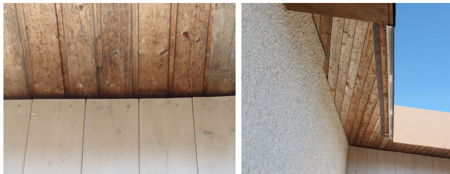
Abb. 9: Spaltenbereiche zwischen dem Dachüberstand und der Außenfassade des Tennis-Vereinsheims.

Zudem wurde auch das Vereinsgebäude nach Nutzungsspuren und potenziell geeigneten Spaltenbereichen abgesucht. Zwischen dem Dachüberstand und der Außenfassade befinden sich kleine Spaltenbereiche, die potenziell als Hangplatz genutzt werden können. Spuren, die auf eine bisherige Nutzung hindeuten würden (z.B. Kot- und Urinspuren, Sekretverfärbungen), konnten jedoch nicht festgestellt werden.