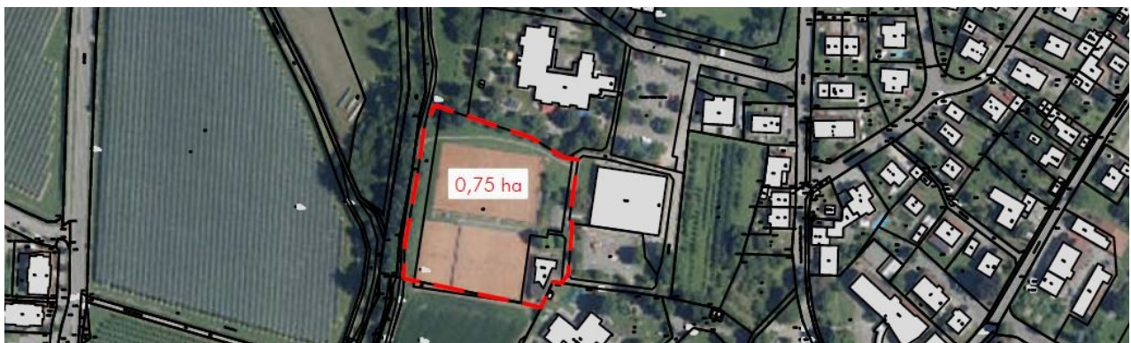
Abb. 2: Grenze des räumlichen Geltungsbereiches des Bebauungsplanes aus dem Abgrenzungsplan.

Nachdem mit der Neufassung des Bundesnaturschutzgesetzes (BNatSchG) vom Dezember 2007 das deutsche Artenschutzrecht an die europäischen Vorgaben angepasst wurde, müssen bei allen genehmigungspflichtigen Planungsverfahren und bei Zulassungsverfahren nunmehr die Artenschutzbelange entsprechend den europäischen Bestimmungen durch eine artenschutzrechtliche Prüfung berücksichtigt werden.